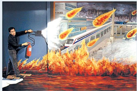
ความโกรธ (จุดไฟเผาตัวเอง)