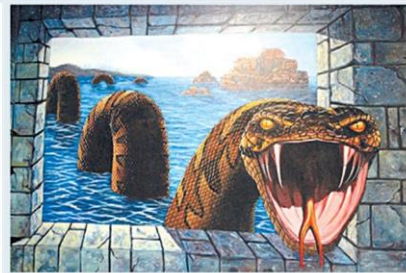
โลภธรรม 8 (อยู่ให้เหมือนลิ้นงูในปากงู)

...ภาพทั้งหมดใช้สีน้ำอะคริลิก วาดลงบนผ้าใบแคนวาส แล้วนำไปติดตั้งบนผนัง เก็บรายละเอียดงาน วาดรายละเอียดเพิ่มเติมเพื่อความเสมือนจริง จากนั้นเคลือบน้ำยาพิเศษเพื่อให้ภาพดูเงางาม ทนทานและสามารถใช้ผ้าเช็ดทำความสะอาดได้ง่ายยิ่งขึ้น แล้วจึงติดตั้งหลอดไฟส่องสว่าง เพื่อให้มีมิติและมีความเสมือนจริงมากที่สุด ให้