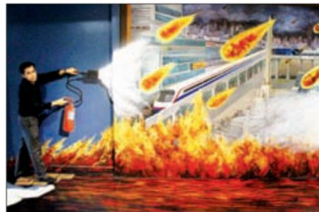
ความโกรธ (จุดไฟเผาตัวเอง)

ผลงานงานงาม ทนทานและสามารถใช้ผ้าเช็ดทำความสะอาดได้ง่ายยิ่งขึ้น แล้วจึงติดตั้งหลอดไฟส่องสว่าง เพื่อให้มีมิติและมีความเสมือนจริงมากที่สุด ให้ความ