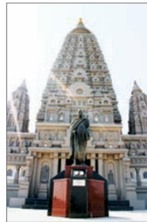
เจดีย์พุทธคยา