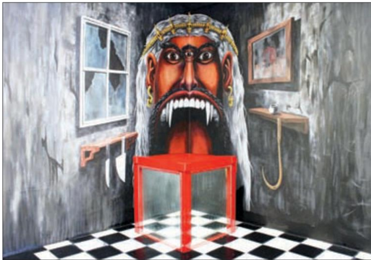
กิเลสมาร-กาลยักษ์ (พญากิเลส)