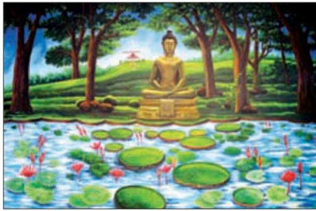
บำเพ็ญนวลโลกุตตรธรรม (เสพเสนาสนะอันสงบ)

หัวข้อข่าว: สื่อสภาพปรโลกธรรม 3 มิติเสมือนจริง ครั้งแรกของโลก