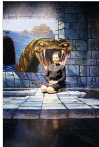
โลกธรรม 8 (อยู่ให้เหมือนลิ้นงูในปากงู)