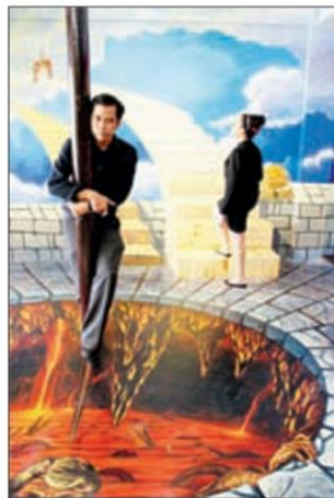
ภาพหลงยึดมายา