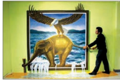
อินทรีย์ (อายุตนะ๖)