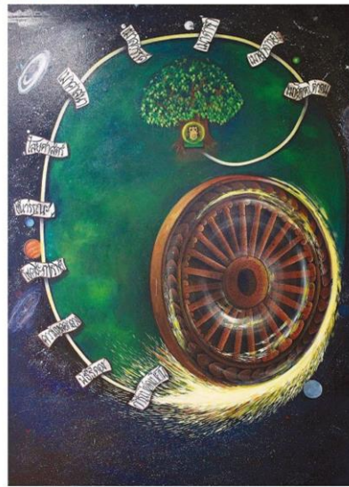
วงล้อแห่งธรรม

ธรรมทั้ง 29 ภาพ ประกอบด้วย ภาพต้นทานที, กาย- จิต, นฤมิตจันทรคราส, อริยชา-โลกาวินาศ, ฝนตกชุกลาด ห้วงน้ำท่วมใจ, โถนาดินแห้ง ร้อนแล้งขัดใจ, เบญจบุปผา พญามาร, กิเลส มาร-กาลยักษ์, สะพานเหล็กขี้-คิล, แม่น้ำคด- น้ำไม่คด อินทรีย์, ต้นไม้แห่ง ไตรลักษณ์ ความโลภ, ความ โกรธ, ความหลง, ความกลัว, บำเพ็ญนวิโลกุตตรธรรม, โลก ธรรม 8, ความพอใจและไม่ พอใจ มหาเจดีย์แห่งการตรัสรู้ มรรคผล, วงล้อแห่งธรรม, และ สุดท้ายเป็นภาพการหลุดพ้น นิพพาน ประกอบด้วย ภาพหลง ยึดมยา ภาพทางสูสวรรค และ ภาพนิพพาน.